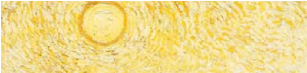
Abb. 1: Vincent van Gogh, Oliviers avec ciel jaune et soleil, 1888 (Ausschnitt)

In der Kunst verfolgt man die Möglichkeiten der Turbulenz und anderer unanschaulicher Topologien seit Langem (Abb. 1, 2, 3).